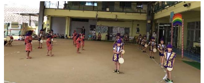
11月4日に行われたリハーサルのもので、エイサー♪を踊っている写真です。